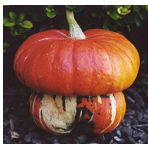
Zucca a turbante turco