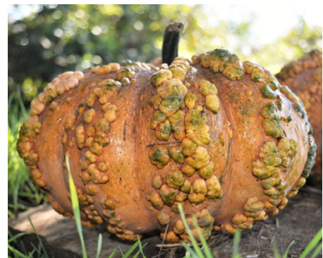
Zucca moscata del Marocco

Cucurbita pepo - I frutti sono di colore vario, dal verde al giallo, anche bianche e bicolori; la forma di solito è allungata, ma talora è anche sferica o lobata (“zucchine patissonsone”); si consumano a frutto immaturo. Sono note diverse varietà anche tradizionali italiane.