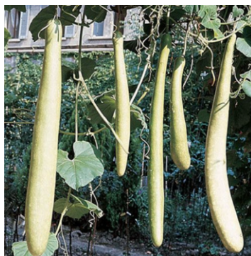
Zucca da pergola ( longissima )