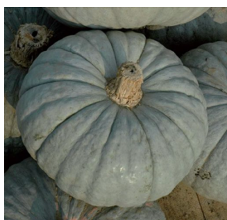
Zucca beretta piacentina