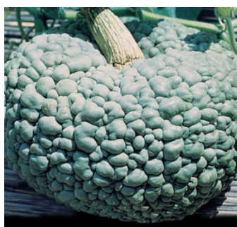
Zucca marina di Chioggia