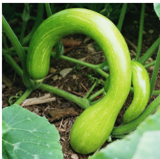
Zucca trombetta di Albenga