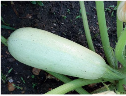
Zucchini bianca di Trieste