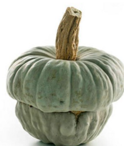
Zucca cappello da prete