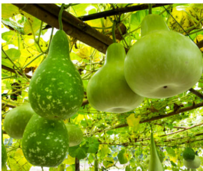
Zucca a fiasco