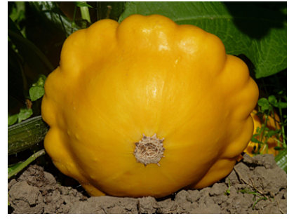
Zucchini patissona gialla