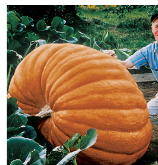
Zucca gialla quintale