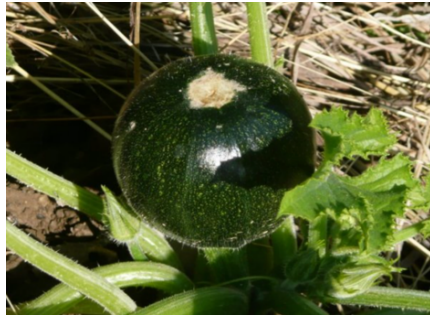
Zucchini tonda di Piacenza