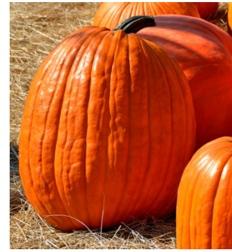
Zucca di Halloween

Lagenaria siceraria – I frutti sono di forma e colore vario, ma sempre lisci; si consumano a frutto immaturo o hanno vari utilizzi (es. contenitori) come frutto maturo. E' l'unica zucca autoctona del Vecchio Continente.