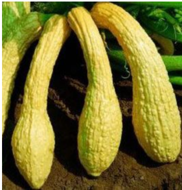
Zucchini giallo rugoso friulano