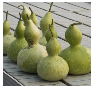
Zucca del pellegrino